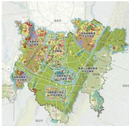
天府新区成都片区规划图

中轴天府大道，北起绕城高速，南与双流华阳接壤，包括“大源”、“中和”两个组团，总用地面积 55 平方公里，其中建设用地 48 平方公里，规划人口 74 万人。