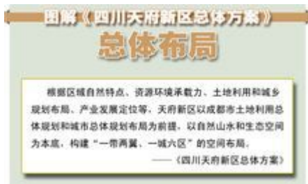
图解《四川天府新区总体方案》（5张）

意设立四川天府新区打造成为内陆开放经济高地、宜业宜商宜居城市、现代高端产业集聚区、统筹城乡一体化发展示范区。 [3-4]