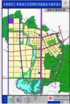
天府新区眉山片区规划图

视高镇 为核心区域，将重点做好仁寿县视高镇 20 平方公里、彭山区青龙镇 25 平方公里控制性详规和城市设计。