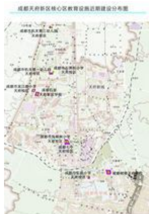
天府新区成都片区核心区卫生教育近期